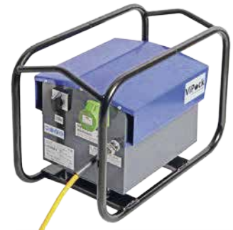
E-POWER 3 - SERIE