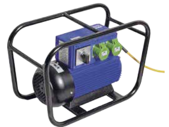
CF - SERIE