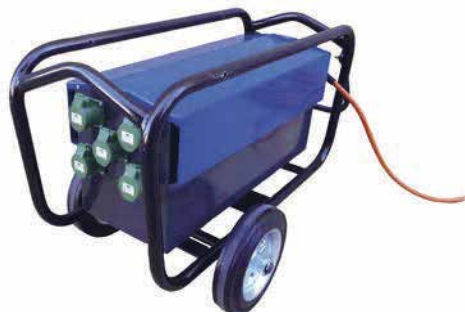
E-POWER 5 - SERIE